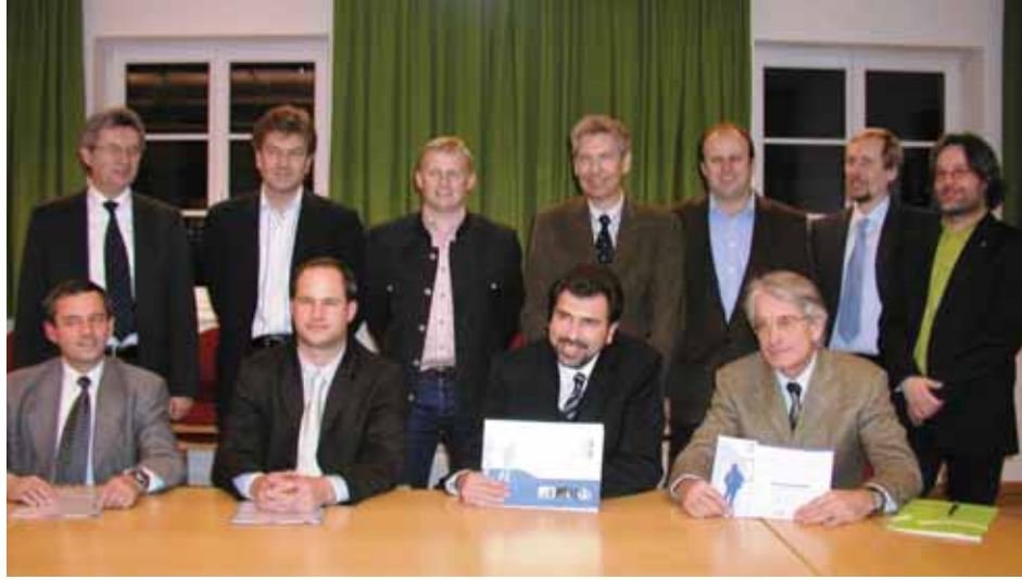
Kuratorium für die HTL Tagesschule 2007

Ab 1970 hatte schon das Mupäd das Tages- schulheim angeboten , das seit 1980 als Tages- heimschule weitergeführt wird.