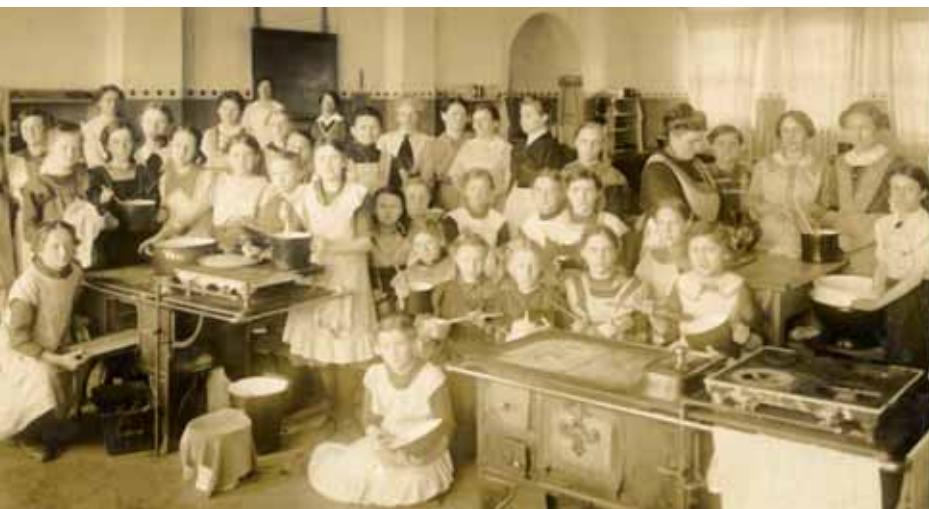
Schulküche der Mädchenvolksschule um 1916

Außer den Hauptschulen wurde die Berufsschule weitergeführt. Schon 1938 bestand in Deutschlandsberg eine gewerbliche Berufsschule. 1942 erhielt diese zwei Baracken für den Unterricht, die jedoch nicht ausreichten, weshalb man sich mit Räumen in Gaststätten und Notunterkünften zufriedengeben musste.