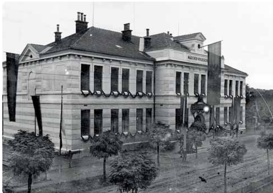
Einweihung Mädchenvolksschule 1906 (heute: NMS 2)