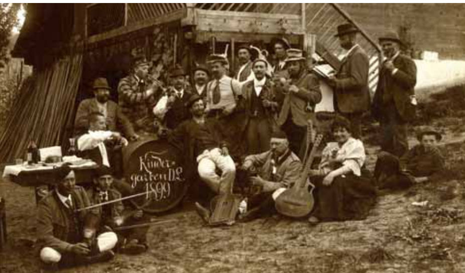
Kindergartengesellschaft um 1890