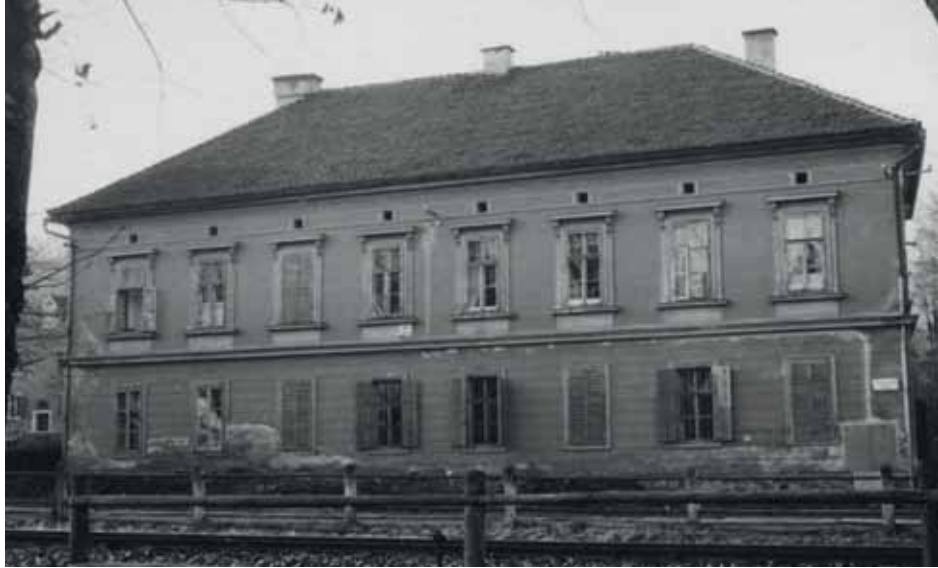
Berufsschulgebäude 1955 vor dem Umbau (heute: Polytechnische Schule)

Mit den Schulgesetzen 1962 kam es zu tiefgreifenden Änderungen, die Schulpflicht wurde auf neun Jahre verlängert und als Anschluss an die HS die Polytechnischen Schulen gegründet. 1965 wurde diese Schule vom Direktor der HS I geleitet. Da die Schulhäuser in der Kriegszeit stark gelitten und in der unmittelbaren Nachkriegszeit nur notdürftig wiederhergestellt wurden, begann man 1950 mit dem Zubau zur bestehenden Knabenvolksschule, der 1953 fertiggestellt wurde.