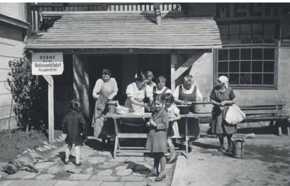
NSDAP-Ausspeisung (heute: Hof der Stadtbücherei)