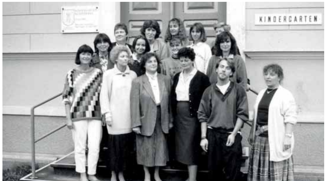
Team des Kindergartens Stiftungspark und des Heilpädagogischen Kindergartens 90er-Jahre