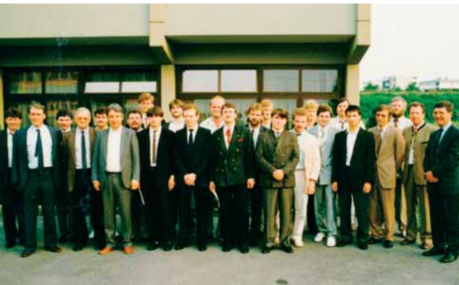
BFI-Lehrgang in den 80er-Jahren