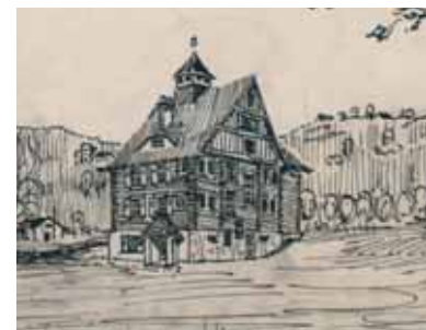
Entwurf Bürger Schulbau 1920, Burgegg (gegenüber „Hietlbad“)

1890 wurde der Kindergarten mit 24 Kindern eröffnet.