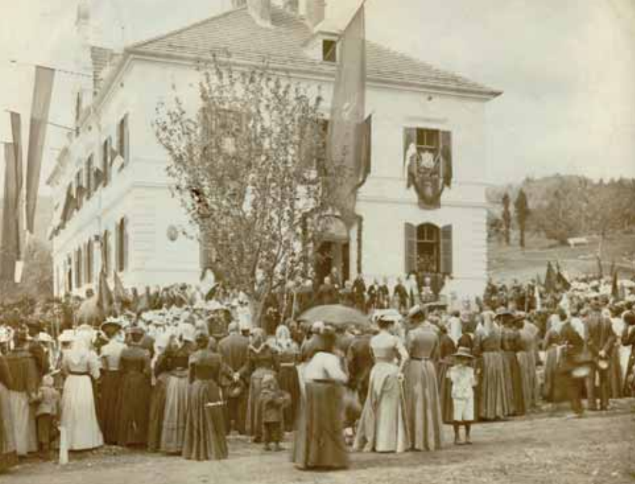
Schlusssteinlegung Stiftungshaus 1902 (heute: Kindergarten Kloeepferweg)