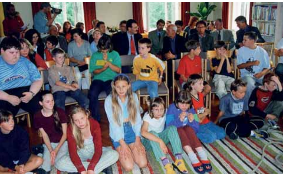
CD-Projekt der ASO 2007

Seit 2017 gibt es im BFI das KUKA-Robotik- College , eine Zusammenarbeit mit dem interna- tionalen Konzern KUKA-Roboter GmbH für den Fachbereich Mechatronik-Automatisierungs- technik, das bisher nur in Linz angesiedelt war.