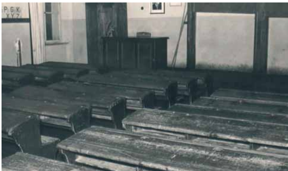
Inneneinrichtung Volksschule vor 1950

1969 stieg die Zahl der Kindergartenkinder auf 101, weshalb eine Vergrößerung im Stiftungshaus unumgänglich war. Schon in diesem Jahr bot die Gemeinde einen Ferienkindergarten an, scheiterte aber an den hohen Kosten für die Eltern. Dieser wurde erst 1997 umgesetzt.