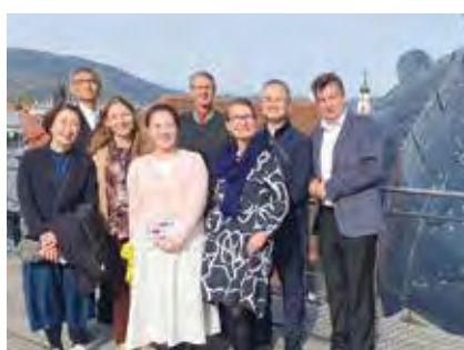
Der Stadtrundgang in Graz führte auch beim Kunsthaus vorbei.

Die TDK hat ihren Ursprung in einer über 85-jährigen Geschichte, in der sie von ihrem Hauptsitz in Tokyo/Japan aus zu einem weltweit agierenden Unternehmen herangewachsen ist. Der TDK-Standort in Deutschlandsberg spielt eine entscheidende Rolle als Entwicklungs- und Fertigungszentrum für TDK Electronics und den gesamten TDK-Konzern. Mit einer beeindruckenden Fläche von mehr als 70.000 Quadratmetern ist Deutschlandsberg das größte TDK-Werk in Europa.