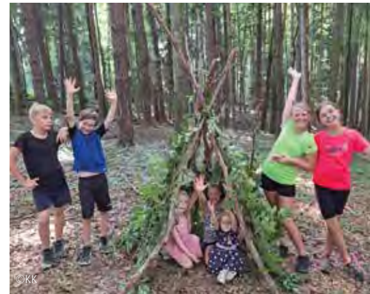
Bei den Erlebnistagen lernten die Kinder viel über die Natur.

Fotos beider Veranstaltungen findet man auf der Website der Naturfreunde.