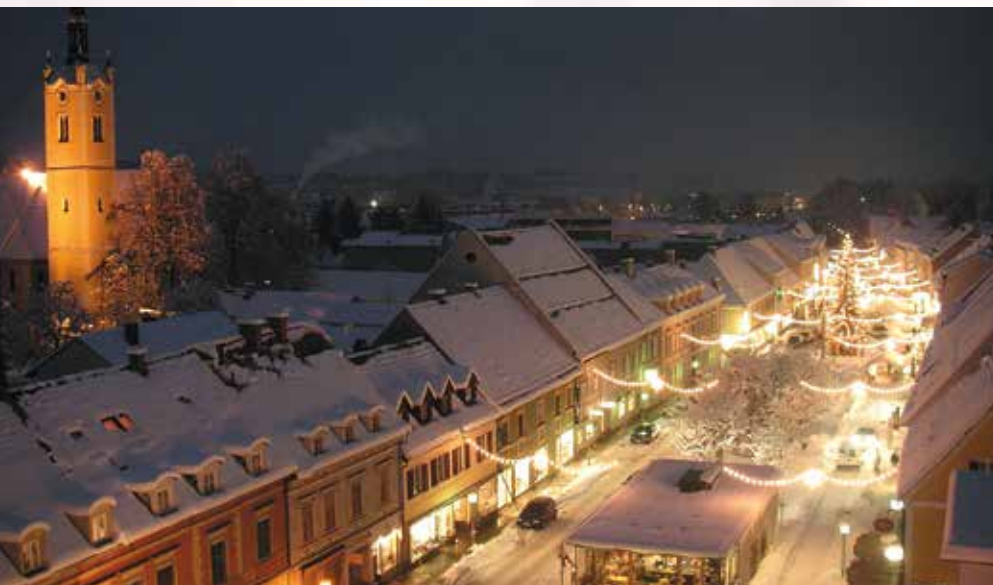
Genießen Sie die vorweihnachtliche Stimmung am Hauptplatz!

Die besinnliche Vorweihnachtszeit hält wieder Einzug in unserer Stadt und versprüht einen ganz besonderen Zauber.