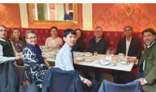
Kaffeepause im Café Sacher Graz