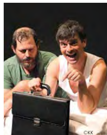
Die Vorbereitungen für die Premiere laufen auf Hochtouren.

TERMINE, INFOS & KARTENRESERVIERUNGEN: 034 62 / 6934, www.theaterzentrum.at