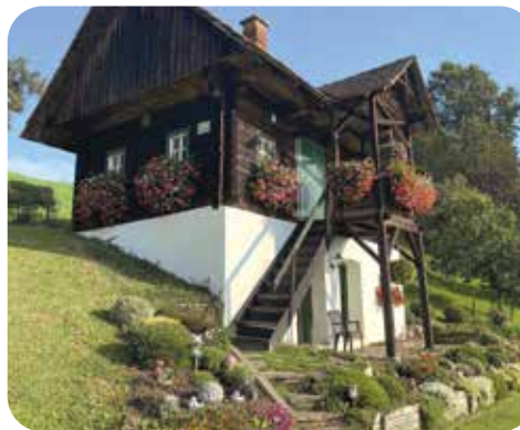
Erna und Eustachius Reinisch, Deutschlandsberg