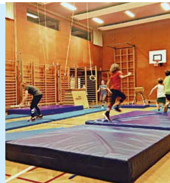
Das Trainer:innenteam des Schiklubs lädt alle interessierten Kinder und Jugendlichen zur gemeinsamen Saisonvorbereitung in den Turnsaal der MS 1 oder 2 DlbG. ein.

Es wird um Voranmeldung bei den Trainer:innen gebeten.