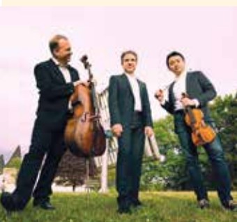
Altenberg Trio Wien

Drei Großmeister des subtilen kammermusikalischen Jazz treten nach Jahren endlich wieder hier auf.