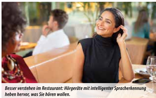
Besser verstehen im Restaurant: Hörgeräte mit intelligenter Spracherkennung heben hervor, was Sie hören wollen.

Moderne Hörgeräte von Hansaton können Ihnen dabei helfen!