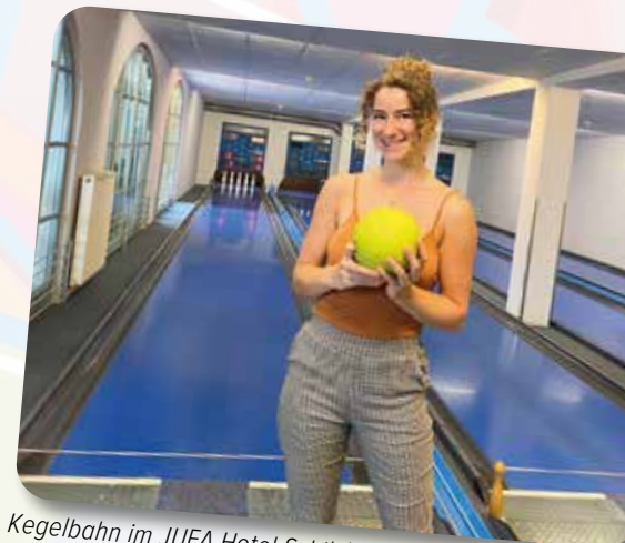
Kegelbahn im JUFA Hotel Schilcherland