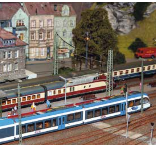
In der Schweighofer-Passage kann man in die Welt der Miniatur-Eisenbahn eintauchen.

Nach umfangreichen Revisionsarbeiten nimmt die Modellbahn Deutschlandsberg am Hauptplatz 9 mit neuer Energie den Fahrbetrieb wieder auf.