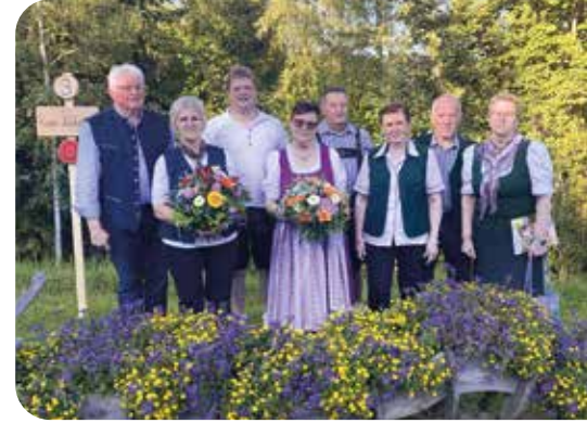
Unsere Preisträger:innen bei der Siegerehrung der Flora 23 auf der Soboth