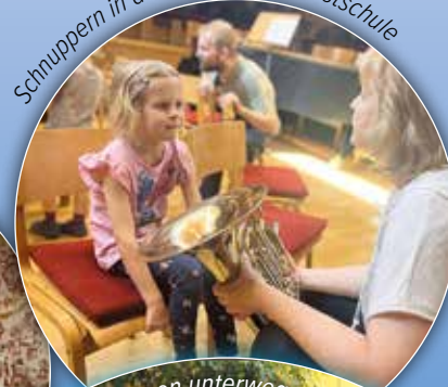
Schnuppern in der Musik- und Kunstschule