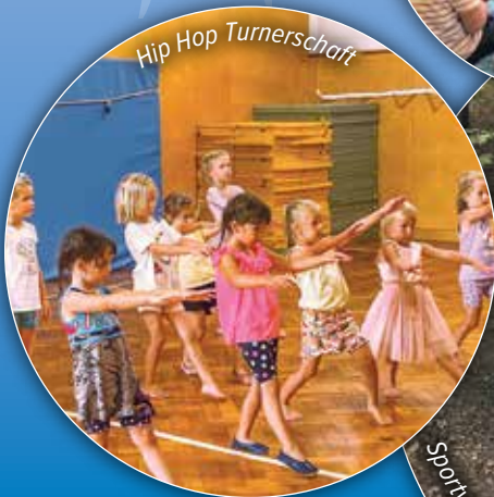
Hip Hop Turnerschaft