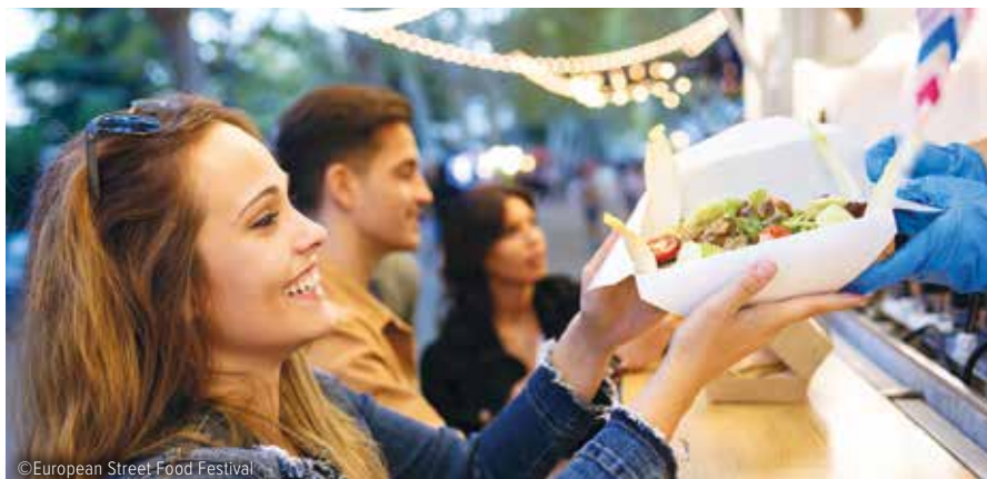
Dutzende Food-Stände bieten ihre Köstlichkeiten am Hauptplatz an.