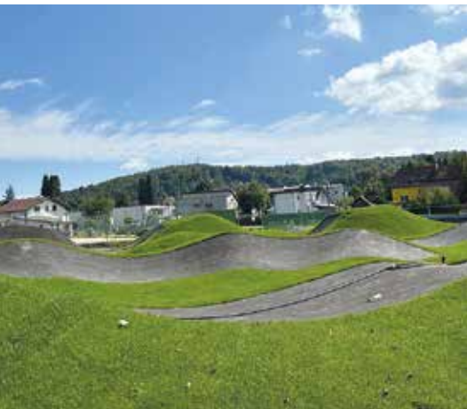
Die Pumptrack-Anlage im Freizeitpark Hörbing wird in Kürze ihrer Bestimmung übergeben.