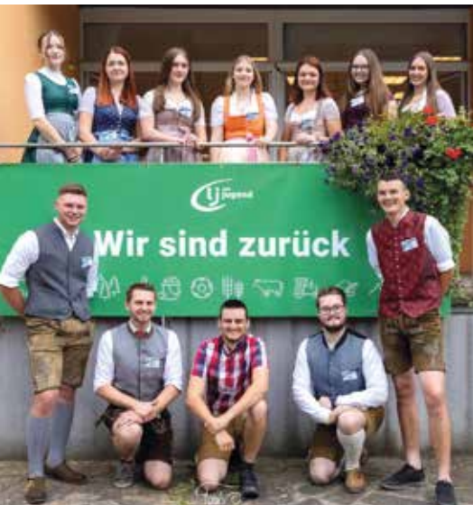
Das junge, motivierte Team

In Bad Gams und Wildbach engagiert sich die Jugend tatkräftig.