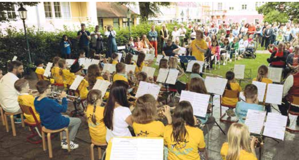
Die Parkkonzerte 2023 wurden von Schüler:innen der Musik- und Kunstschule Deutschlandsberg unter begeistertem Applaus eröffnet.

Interessierte, die selbst Lust auf Musik haben oder ihre Kinder gerne musikalisch fördern möchten, haben immer noch die Möglichkeit, sich für das laufende Schuljahr anzumelden. Die Anmeldungen werden über das Online-Formular auf der Website der Musik- und Kunstschule Deutschlandsberg entgegengenommen.